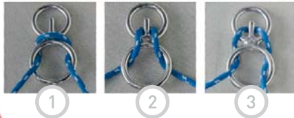
3 mögliche Widerstände