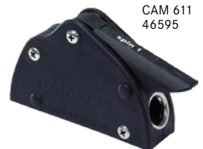
CAM 611 46595