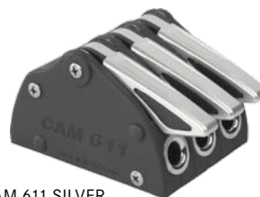
CAM 611 SILVER 46618

Für Fallen von 6-10 mm Taustärke. Erhältlich als 1-fach-, 2-fach- oder 3-fach Stopper. Auch als SILVER-Version mit ergonomischem, silber eloxierten Aluminium-Hebel. Länge 118,5 mm, Höhe 73 mm. Lochabstand 79 mm. Zur Befestigung werden Schrauben mit M6-Gewinde benötigt.