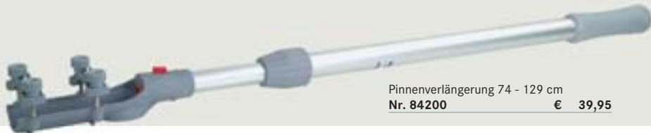
Pinnenverlängerung 74 - 129 cm Nr. 84200 € 39,95

Universal-Verlängerung für Außenborder-Drehgaspinnen. Mit Patentverschluss für strammen Sitz auf dem Drehgriff. Verlängert die Drehgaspinne von 74 - 129 cm. Kürzeste Länge über alles: 88 cm.