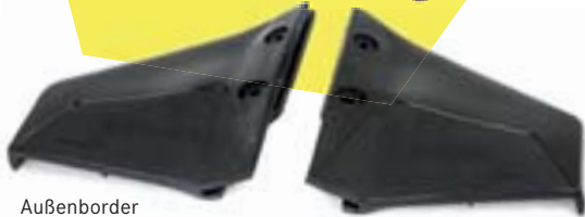
Außenborder Hydro Foils