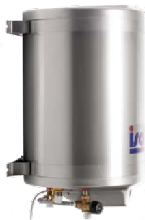
40364 BASIC 40