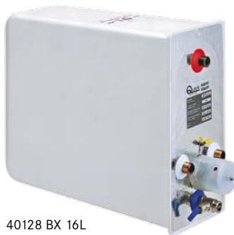
40128 BX 16L

Speziell für den Betrieb an Bord konstruierte Warmwasserboiler, gefertigt aus rostfreiem Edelstahl. Die Boiler verfügen über einen integrierten 230 V Heizstab (750 W) und werden komplett mit Mischventil und Sicherheitsventil (7 bar) geliefert. Zusätzlich zum Heizstab wird die Abwärme des Motor-Kühlkreislaufes zur Warmwasserbereitung genutzt. Bauformbedingt kann die Installation wahlweise waagrecht oder senkrecht erfolgen. Zum Schlauchanschluss werden optional erhältliche 1/2" Schlauchtüllen benötigt.