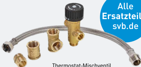
Thermostat-Mischventil SIGMAR / QUICK