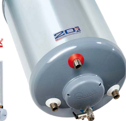
40127 BX 60