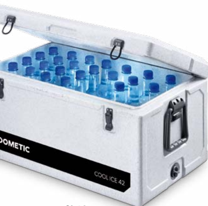
CI 42 (LxBxH): 64 x 42 x 36 cm