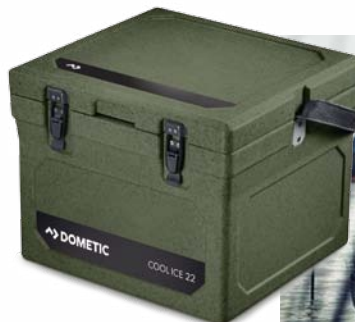
WCI 22 (LxBxH): 36 x 39 x 31 cm Ab € 111,95