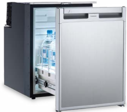
CD 30 Front schwarz Ab € 805,00