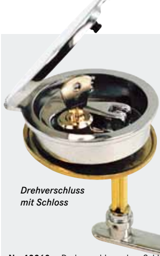
Drehverschluss mit Schloss