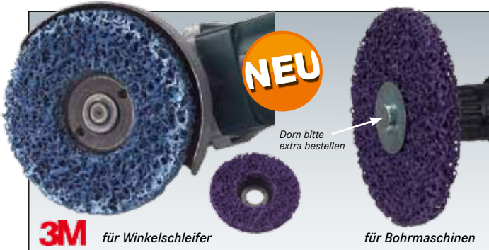
3M für Winkelschleifer