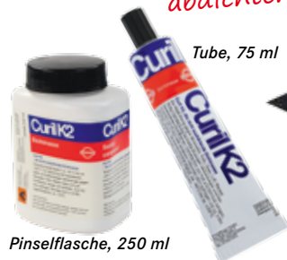
Pinselflasche, 250 ml