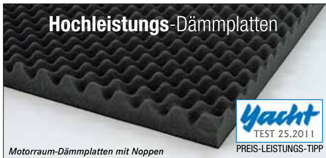
Motorraum-Dämmplatten mit Noppen