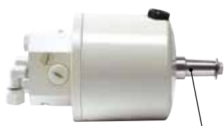
Konus 1:12, ø 3/4"