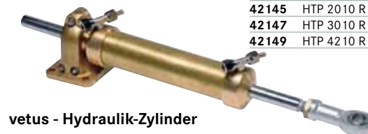
vetus - Hydraulik-Zylinder