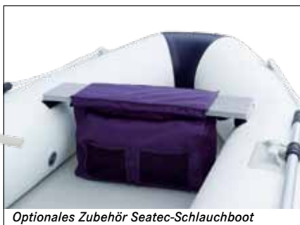
Optionales Zubehör Seatec-Schlauchboot