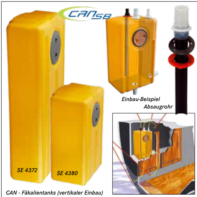
CAN - Fäkalientanks (vertikaler Einbau)