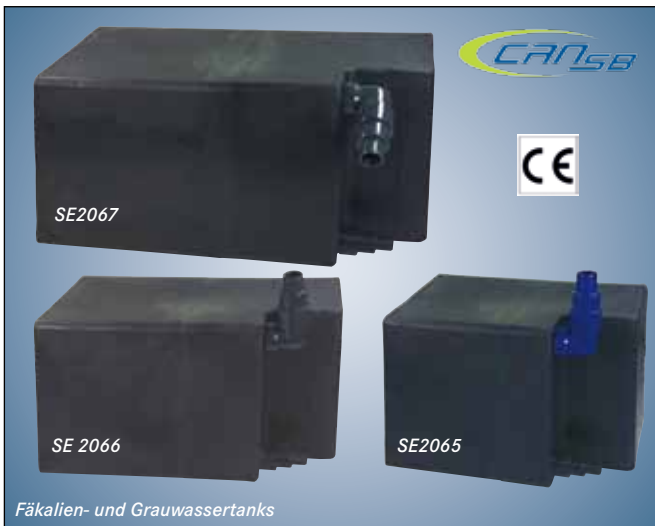
Fäkalien- und Grauwassertanks