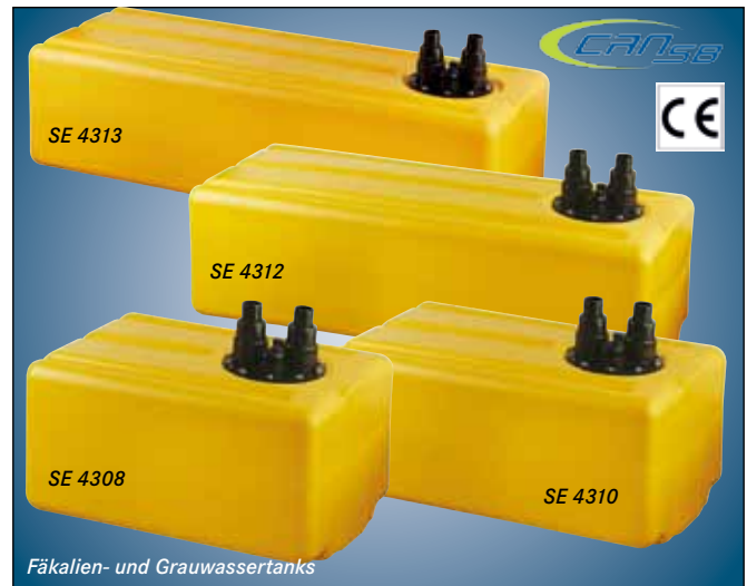
Fäkalien- und Grauwassertanks