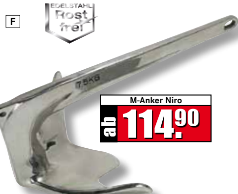
M-Anker - Edelstahl