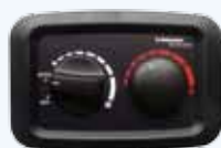
Thermostat mit Gebläsesteuerung