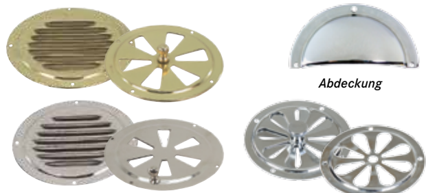
Lüftungsrosetten Ø 125 mm