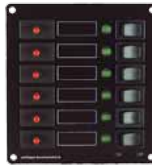
Typ STV 106