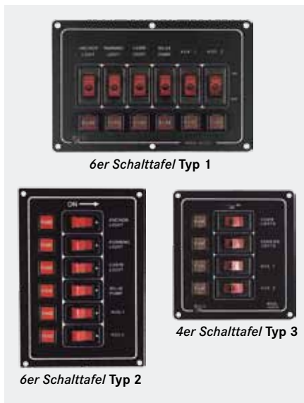
6er Schalttafel Typ 1